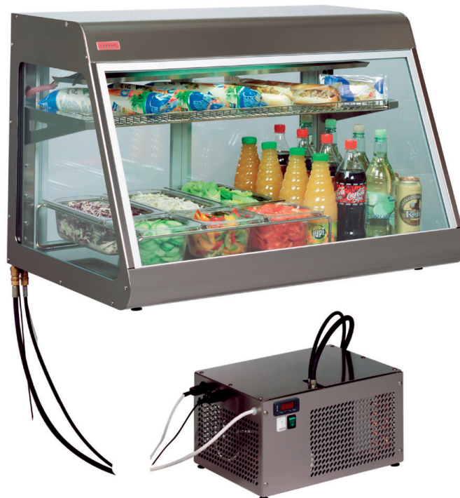
Big Horn remote Dimension på maskindelen: B=450, D=300, H=350 mm